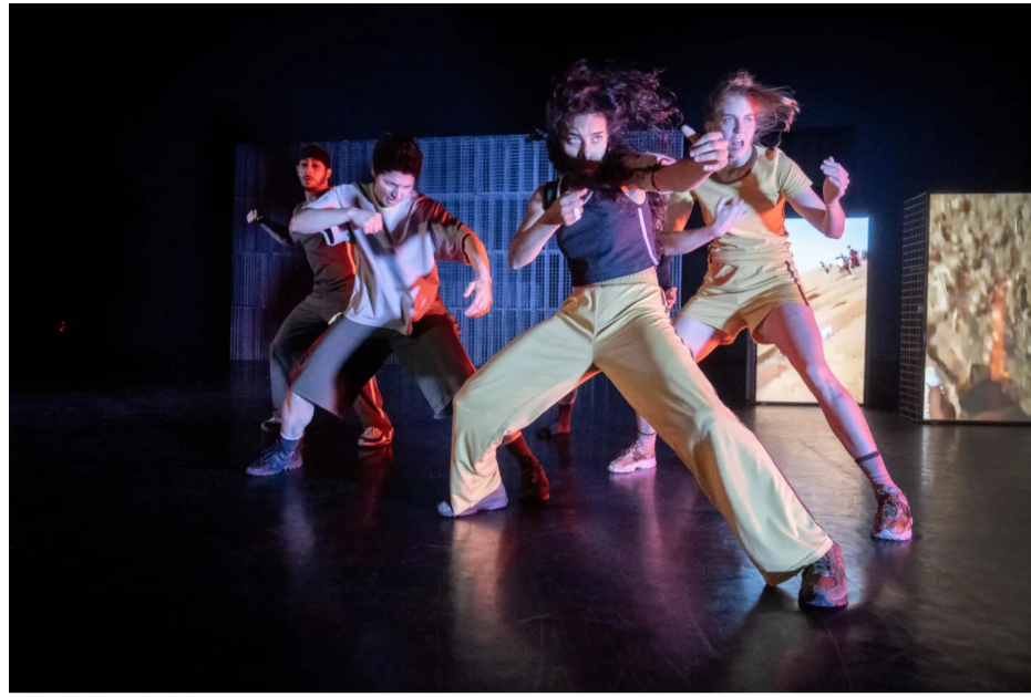
De meest radicale poging om de toeschouwer bewust te maken van de genocide in Gaza en de complexiteit van de Israëlisch-Palestijnse kwestie was ongetwijfeld 'Perzen'.

We volgen een groep toneelstudenten aan het Vlaams Toneel Gent in een volledig door nationalistische autocraten gedomineerde samenleving in 2031. De docente is rechts en pro-Israëliësch, maar de acteurs zijn een gemengde groep waar ook Palestijnen deel van uitmaken.