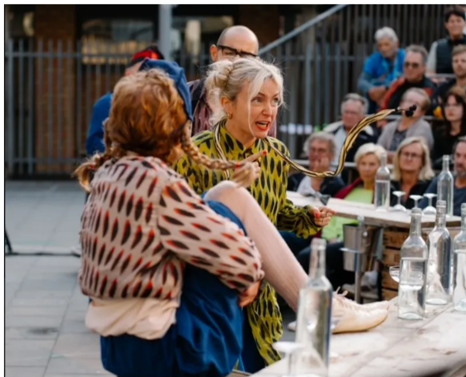
Een waar feest was de productie 'Lorenzo, de paljas van Firenze' van Comp. Marius.