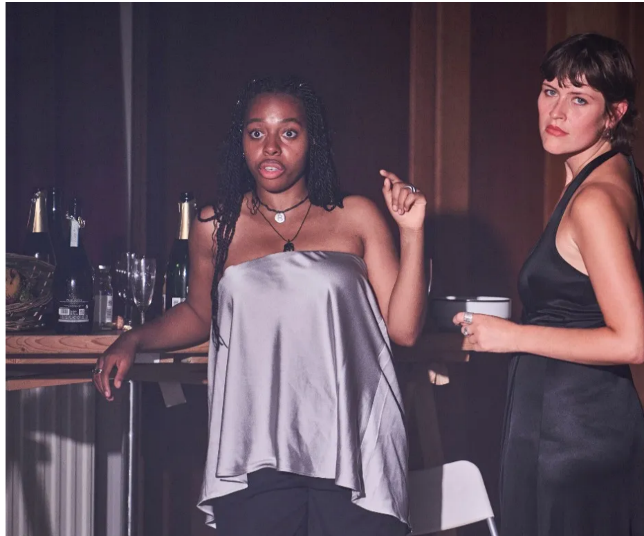
De metafoor van 'Rien ne va plus' is duidelijk; een carrière in het theater is een enorme gok.