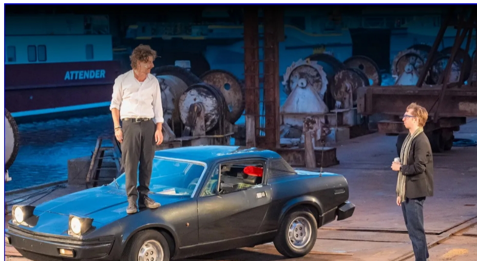
Ook in 'Parkplatz' van Compagnie Cecilia staat het ouderwetse spelplezier centraal.